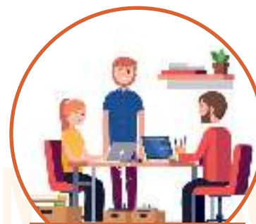
EMPRESA EN MARCHA