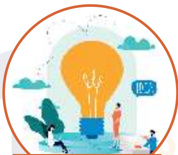
IDEA DE NEGOCIO

Los proyectos de desarrollo empresarial presentados por los semilleros son soluciones de conocimiento aplicadas al sector empresarial, generalmente a la creación de nuevas empresas u opciones de negocio. Los proyectos en esta línea se pueden presentar en las siguientes modalidades: