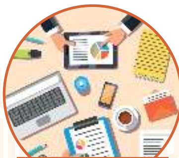
PLAN DE NEGOCIO