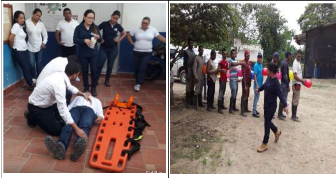
Figura 2. Actividades Realizadas por los Estudiantes.