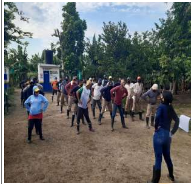
Figura 3. Actividades Realizadas por los Estudiantes.