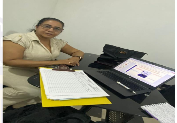
Participantes sector productivo