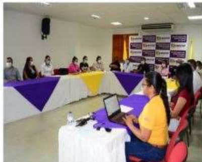
Grupos e investigadores del INFOTEP HVG logran positivos resultados en convocatoria de medición de MinCiencias